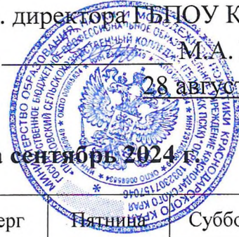
График загрузки спортивных залов на сентябрь 2024 г.