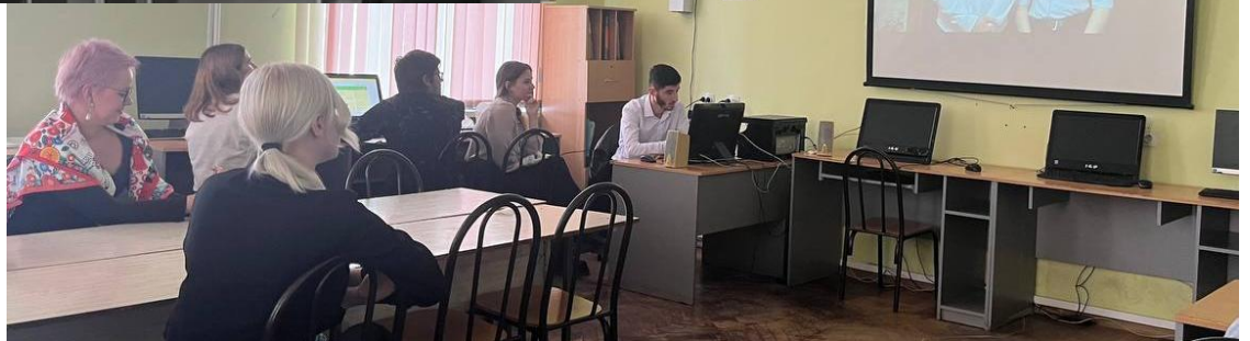
«Арт-терапия в работе с пожилыми людьми или увлекательный мир открытий»