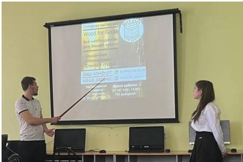
Презентация бизнес-плана «Создай свое дело»;